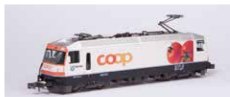
7074039 Coop #641 € 179,99*