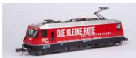
7074040 Die kleine Rote #650 € 179,99