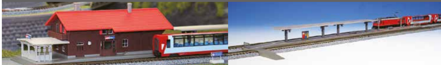
7023245 Schweizer Alpen-Bahnhof »Filsur« € 47,30