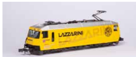
7074038 LAZZARINI #644 € 179,99*