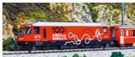
7074043 100 Jahre Albula & Ruinaulta #642 € 199,99