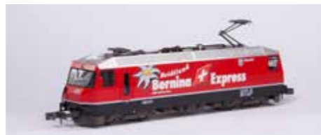
7074037 Bernina Express Heidiland #641 € 179,99*